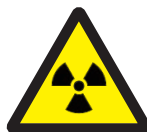
Warning: Radiation 放射能注意