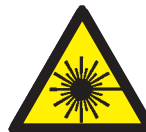
Warning: Laser Beam レーザー注意