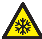
Warning: Low Temperature / Freezing 低温注意