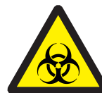
Biohazard バイオハザード注意